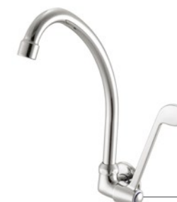
Cód. 26264 TORNEIRA COZINHA PAREDE 1187 C 58 BJ