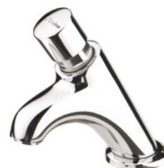
Cód. 6453 TORNEIRA BANCADA MEBERMATIC 10000 C