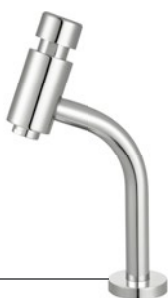
Cód. 26783 TORNEIRA LAVATÓRIO BANCADA MEBERMATIC 10075 C