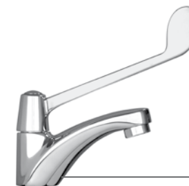
Cód. 25770 TORNEIRA LAVATÓRIO BANCADA 1193 C 58