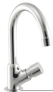
Cód. 25744 TORNEIRA BANCADA MEBERMATIC 10090 C