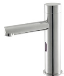
Cód. 26561 TORNEIRA ELETRÔNICA 10076 C