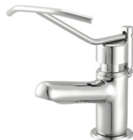
Cód. 26701 TORNEIRA BANCADA MEBERMATIC 10065 - COM ALAVANCA