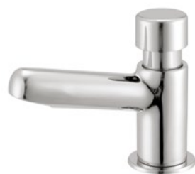
Cód. 26302 TORNEIRA BANCADA MEBERMATIC 10065 C