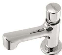
Cód. 25484 TORNEIRA BANCADA MEBERMATIC 10060 C