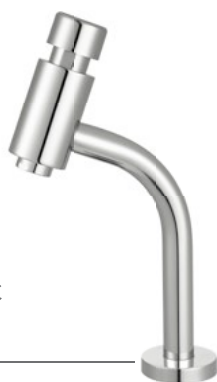
Cód. 26783 TORNEIRA LAVATÓRIO BANCADA MEBERMATIC 10075 C